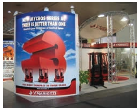
CeMAT kiállítás Németország